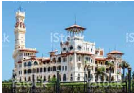
Montaza Palace in Alexandria, Egypt