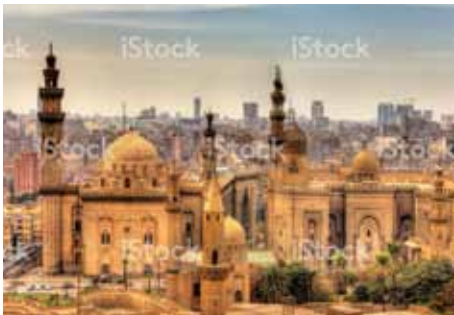
Panoramic view of the Mosques of Sultan Hassan and Al-Rifai

***Aturcara am ini adalah sebagai rujukan awal sahaja dan tertakluk kepada perubahan jadual penerbangan, perubahan masa dan lain-lain faktor semasa di luar kawalan syarikat.